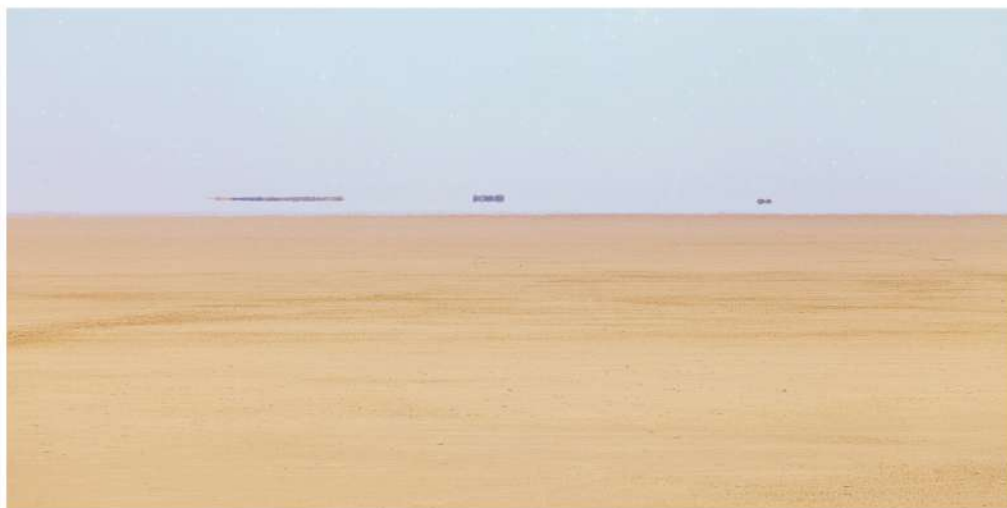
Chott el Djerid

Du minimalisme visuel du désert, caractérisant l'enracinement de Luke Skywalker au début d' Un Nouvel Espoir (1977), aux étroits canyons de Midès, qui inspirèrent les virages les plus serrés de la course de module de La Menace fantôme (1999), l'héritage est bien là.